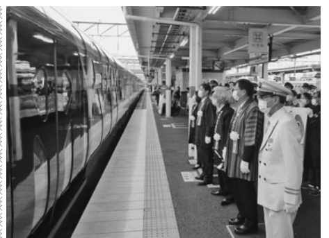
四季島を見送る渋川会頭(右から3人目)ら

生を対象に、建設業の社会的役割を学び、魅力発見に繋げることを目的に企画したもので、今回初の開催となる。見学先では、会津若松地方広域市町村圏整備組合「環境センター」よりそれぞれの施設の役割等について説明。始めに令和3年4月より供用開始となったし尿処理施設を見学。続いて見学した建設中の沼平第三最終処分場の建設現場ではドローンを飛ばし、上空からの映像を確認した。また、移動中の車内では、「會津美レディ」による建設業の魅力についての説明があった。参加者たちは、普段入ることのできない現場を目にし、建設業に対する理解を深めた。