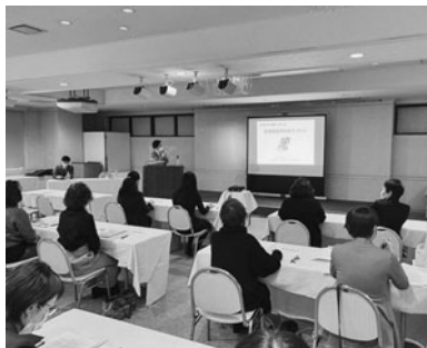
熱心に聞き入る参加者

マートシティの取組」と題し教養講座を開催。会員19名が参加した。市企画調整課職員より当市のまちづくりとスマートシティ構想について、第7次総合計画の中間評価や今後5カ年の計画など実際の事例を交え説明を受けた。なお、今回市の取組を知ること、今年度4年ぶりとなる市への提言をより良いものにしたと考えている。