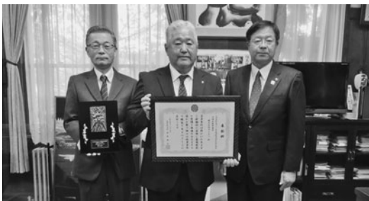
《受賞事業所》 株式会社ダイエツ ・事業内容 測量業、建設コンサルタント、地質調査業、補償コンサルタント ・障がい者雇用率 7.4%

この事業は、障がい者を積極的に雇用し、雇用環境を整えるなど、他の事業所の模範となる事業所を「会津若松市長賞」として表彰し、そのすばらしい取り組みを、市民の方や企業に広く啓発することにより、市全体の障がい者雇用意識の高揚を図ることを目的に実施し