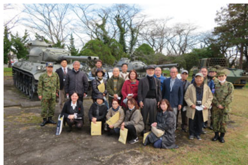
61式・74式戦車をバックに記念撮影

他にも、隊員食堂での昼食、売店で自衛隊グッズを購入するなど、駐屯地内の隊員の様子に触れ、自衛隊への一層の理解を深めた。