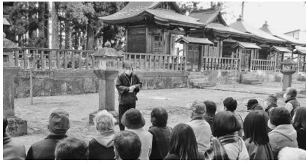
上杉家廟所にて説明を受ける参加者

11月21日会津ゆかりの地「米沢」を巡る共済ツアーを実施、36名が参加した。上杉謙信公など歴代藩主の廟屋が並ぶ上杉家廟所や、初代藩主・上杉景勝と家老直江兼続が祀られる松岬神社、ものが生まれる力をもつ「むすひ」の神様として崇められる東北の伊勢「熊野大社」等を参拝。見学先では、会津初代藩主・保科正之公が上杉家存続の危機（後継ぎ問題）を救ったなど、随所で会津のとの繋がりを感じられる内容で、参加者は米沢を満喫していた。