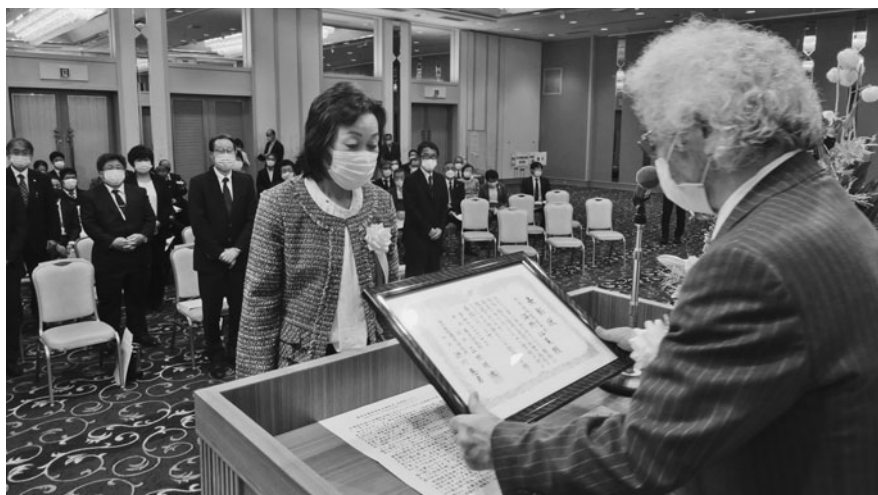
各表彰区分ごとの代表従業員へ表彰状を伝達

張りがあってこそであり、財は宝である。今後の経済再生には皆さんの力が必要であり、アフターコロナは会津の時代となるように共に頑張りましょう」と挨拶。