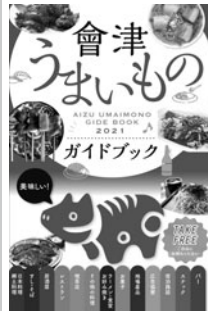
「2021年版のガイドブック」

このガイドブックは、観光客や教育旅行生をはじめ、地元の皆様にも大変好評で、今回は新たに、会津若松市のアップルマップを活用したまちづくりアプリ「ペコミン」と連携し、より利用しやすくなります。