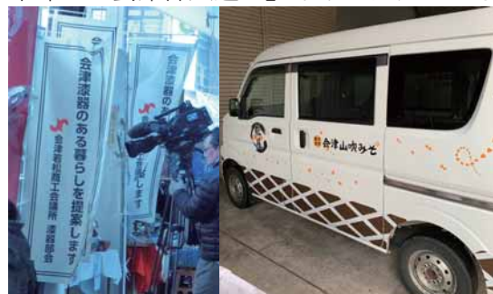
施工例 (のぼり・営業車両)