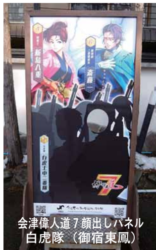
会津偉人道7顔出しパネル 白虎隊 (御宿東鳳)