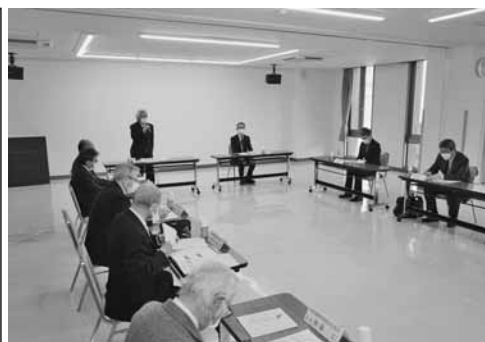
確定申告期の協力事業を決めた理事会

会津若松税務関係団体協議会（会長・渋川会頭）は1月26日、当所で理事会を開催。2月16日からの令和3年確定申告期間における協力事業を決めた。