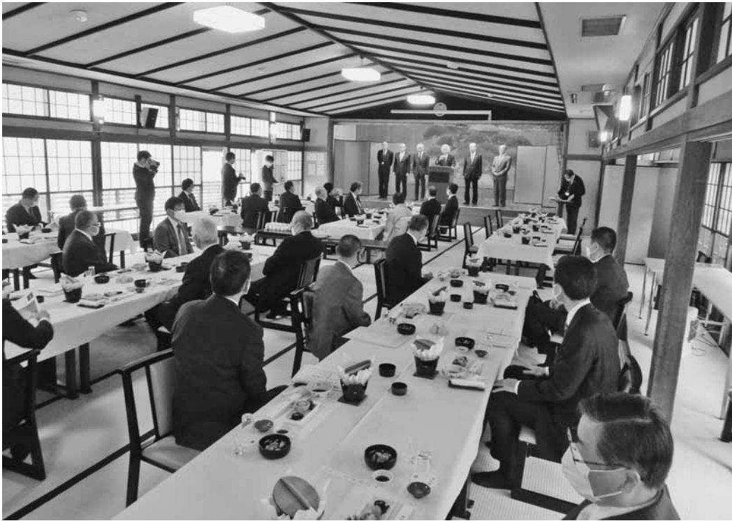
経済のV字回復に向け、更なる協力を求める渋川会頭

1月4日、萬花楼において議員新年会を開催。コロナ禍で2年振りとなった今回は、感染防止の観点から規模を縮小、来賓及び役員38名が出席した。