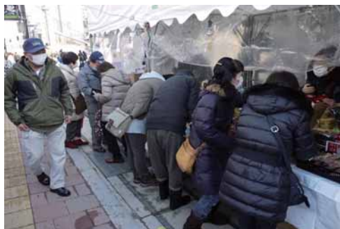
掘り出し物の漆器を買い求める市民ら

当日は天候にも恵まれ、お椀や皿、箸などの日用品のほか、パネル、干支関連のインテリア商品など様々な漆の商品が並び、大変多くのお客様まで賑わった。「出店事業所」(旬会津クラフト/桜工芸/榎台和会津宮