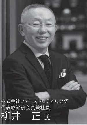
株式会社ファーストリテイリング 代表取締役会長兼社長 柳井 正 氏

コロナ禍で奮闘している会員企業、地域の最前線で会員企業を支援している各地商工会議所が、ともに未来への希望を持って、これからの時代を生き抜いてくために、各方面で活躍されている方々をお招きし、オンラインによる特別記念講演会を開催します。