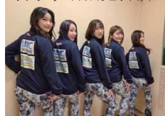
▼商品②福島ファイヤーボンズ チアリーダースのスウェットジャージ

そんなダブデザインさん、今年6月初旬頃に現在の場所から移転してリニューアルオープンを予定してます！新たな店舗ではこれまで以上にオリジナルのアパレル商品など様々なアイテムを取り揃える予定。