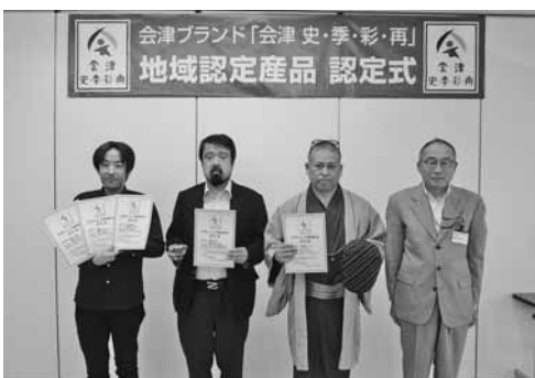
新たに新規認定となった3事業所

の『桜辛味噌鍋』『桜みじつと鍋』『桜開花』の5商品。認定商品は今回認定した5商品を加え51品目となった。認定式終了後には会津ブランド推進委員会を開催。委員6名が出席し、令和4年度の事業計画・収支予算について承認。本年は、新たな選べるギフトセットの販売や、ウェブ上での販売促進を図るほか、認定事業者に対する販路拡大・マーケティング力強化のための勉強会、補助金活用などに向けた個別相談会などを行う。