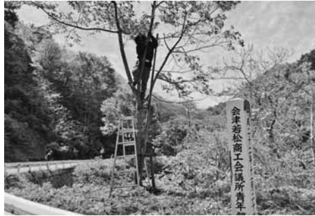
桜の剪定に汗を流すメンバー