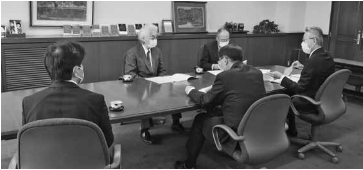
優秀な若者等の地元定着を図るため要請を受ける渋川会頭