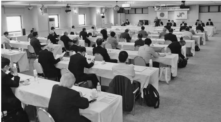
地域経済の正常化へ向け協力を求める洪川会頭

され、明るい兆しが見えてきた。また、全国新酒鑑評会9年連続金賞受賞数日本一、更に日本が魅力的な観光地世界一に輝くなど追い風も吹き、今後経済が大きく動くことを期待している。