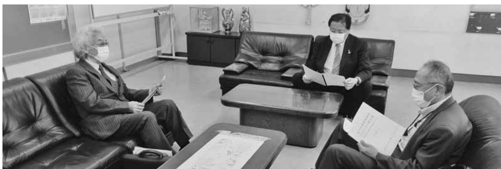
清川市議会議長に提言内容を説明

け止め、提言をどのように生かしていくか検討したい。引き続きいろいろと情報交換していきたい」と応じた。当所では、これを機に市民の声やニーズに応えるべく、市の他、関係機関や団体に働きかけながら当市の未来に向けた新しいまちづくりを進める。