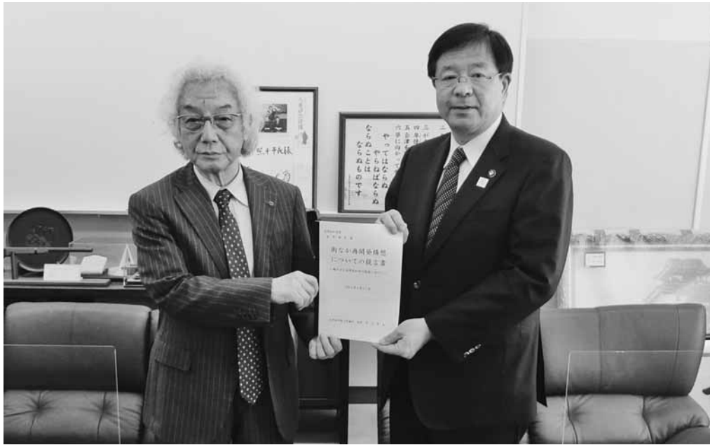
室井市長に提言書を渡す洪川会頭

当会議所では5月11日、市民アンケート結果に基づき、検討してきた「街なか再開発構想」を室井照平会津若松市長、清川雅史市議会議長へ提言した。神明通り周辺エリアや県立会津総合病院跡地など5エリアについて、ソフト・ハードの両面からその土地の特性や環境に合った利活用のあり方を提案した。