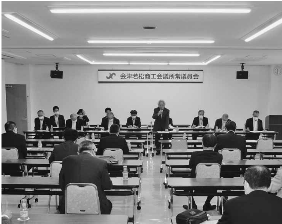
プレミアム商品券の増額発行を承認