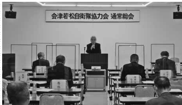
施設見学会をはじめとする新年度事業を承認

ミサイル問題やロシア軍によるウクライナ侵攻など、依然として不安定な状況であり、国民の生命と財産を守る自衛隊の存在はとても大きくその役割は益々重要なものとなっている。当協力会としては、今後も各関係団体との連携を密に、自衛隊の更なる発展と隊員が安心して任務に邁進できるように支援を行ってきたい」と挨拶。