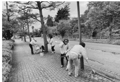
おもてなしの気持ちを込めクリーンアップ！

教育旅行生の姿も市内各地で見かけるようになり、参加者は観光入込の今後ますますの増加を願いながら汗を流した。この奉仕作業は、会津を訪れる観光客へのおもてなしと、日頃から女性会活動