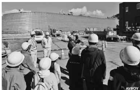
前回の見学会の様子（沼平最終処分場）

※料金表に記載の定員は、平時の定員（カッコ内）の50%としています。 ※非会員は上記5割増。冷暖房使用時は3割増、休日料金はご確認ください。 ※テーブル・椅子等は無料。マイク・スクリーン等の有料貸出備品もあります。 ※本紙3月号掲載の料金表に誤りがありました。正しくは上記のとおりです。