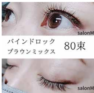
バインドロック 80束 ブラウンミックス