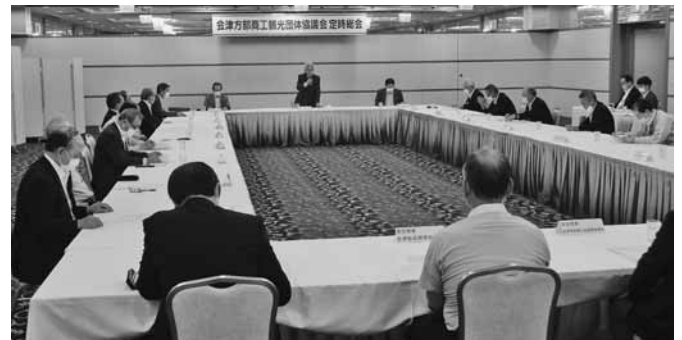
あいさつする渋川会長