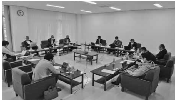
活発に意見を交わした検討会

旨や当所のデジタル化に向けた実施する取組予定などを説明した後、「会員事業所のデジタル化を進めるために我々ができること」のテーマで、自社の取組や取引先とのやりとりなどの経験を踏まえ活発に意見を交わした。 会員企業のデジタル化のレベル感やニーズは多種多様であることから、まずは現在集計中の中小企業デジタル化実態アンケート調査の結果をもとに、ニーズの把握と対象や目標の絞り込みを行っていくこととし、第1回検討会を閉