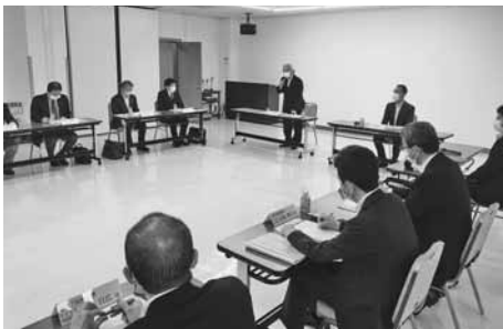
さらなる連携を呼びかける渋川会長

周知などが依頼された後、出席団体から現状や行事予定の報告があり、各団体で協力を確認した。