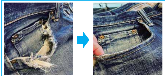
<ジーンズリペアの例>