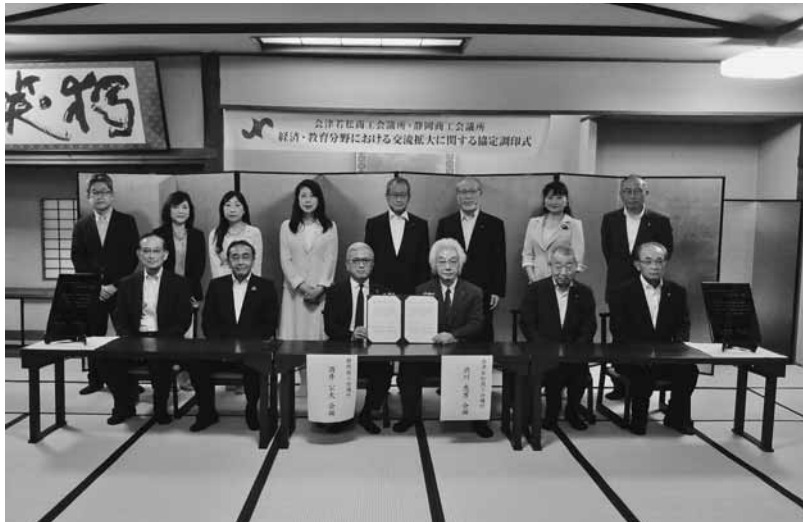
両商工会議所正副会頭らが出席した調印式

の連携事業を進めてきたものが実を結んだもの。来年の大河ドラマ「どうする家康」の放映を前に、ゆかりの地が連携し、コロナ禍の地域経済の回復へ向け弾みをつけるべく協定締結に至った。