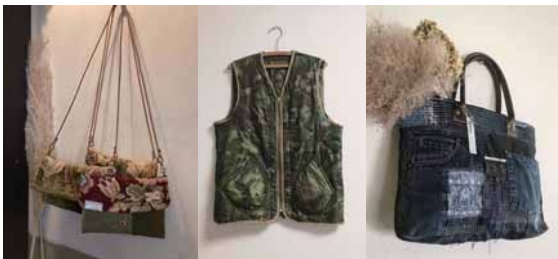
<端切れの生地等を使用した衣類・小物>