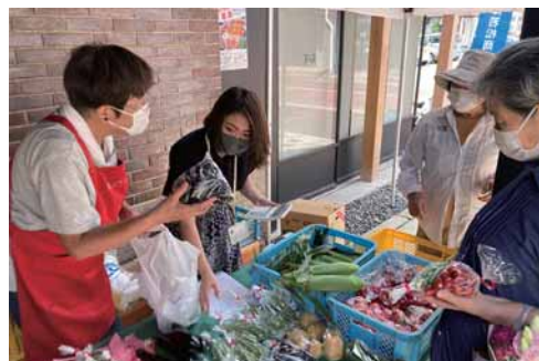
採れたて野菜を販売する農女

卸物流部会は7月26日、福西本店横通路で収穫野菜直売会「お野菜マルシェ」を開催した。 当日はふくしま農業女子ネットワーク会津エリアメンバーらが育てた採れたてのトマトやなすなどの夏野菜やオーガニック野菜、農産物を生かした六次化商品や無農薬で作った玄米のおむすびなどが店頭に並んだ。開始から新鮮な農産物を市民らが買い求めている。 マルシェは、10月まで毎月最終火曜日10時半から12