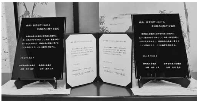
漆の調印書(両端)と当日両会頭が署名をした調印書(中)

◆当日取り交わされた協定書の内容及び今後予定をしている主な連携事業は次のとおり。