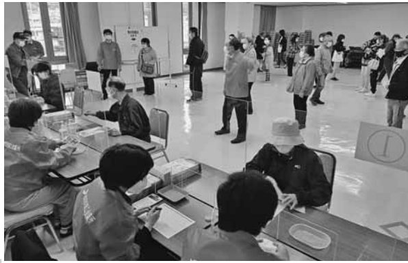
商品券引換に来場した多くの市民

11月3日、会津若松市プレミアム商品券の引換販売初日を迎え、同日より取扱店での利用を開始した。販売初日の3日には、販売会場の当所及びあいづ商工会に、商品券を買い求める多くの市民が駆けつけ、販売窓口に向かう長蛇の列が会場の外まで続いた。