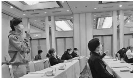
積極的に質問する参加学生