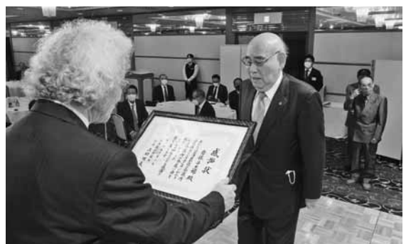
勇退者へ感謝状を贈呈