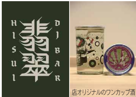
店オリジナルのワンカップ酒

【住所】馬場町1-8 キヨミズビル2階 【営業時間】水～土 午後8時～午前0時 【電話】080-5646-1342