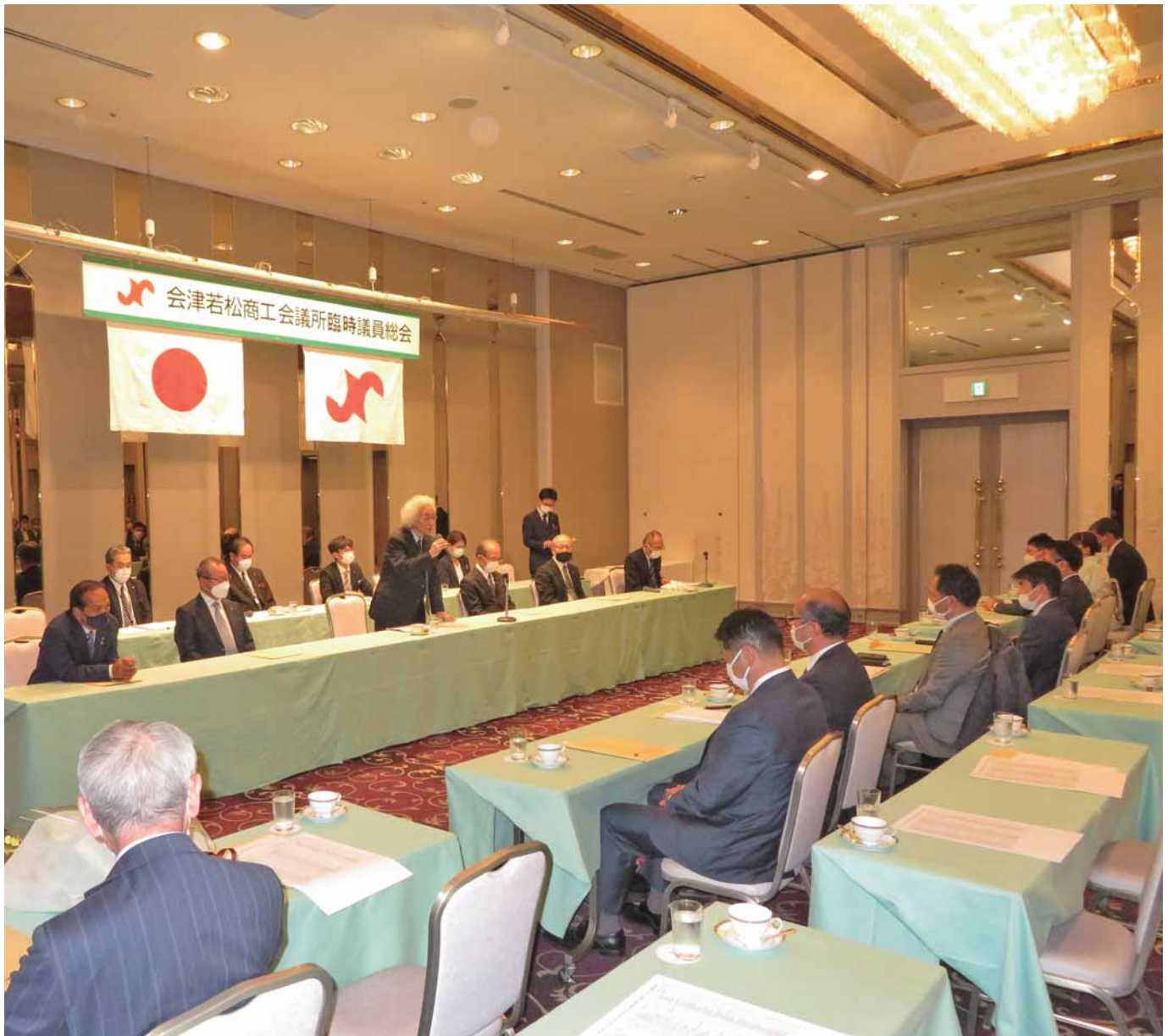
渋川会頭体制 3 期目をスタート