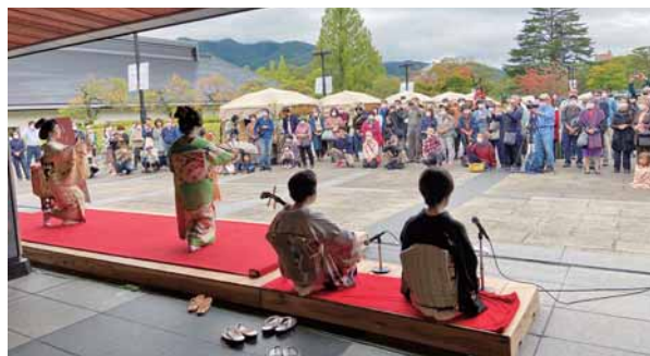
多くの来場者の前で東山芸妓の魅力を披露(県立博物館前)