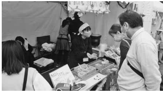
熱心に販売する児童たち

を利用した児童図書寄贈事業」が対象となった。大会には全国から約1500名が参加（このほかオンラインで130単会が参加）した。当女性会からは22名が大会に臨んだ。7日夕には郡山市5会場で懇親会、8日はビッグパレットふくしまで本大会を開催、復興を続けるふくしまの今をアピール。当女性会も開催の一員として、全国各地からの参加者を心を込めてもてなした。