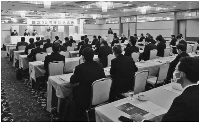
関係各位へ感謝の意を表した記念式典

た。その後、悲願である会津大学開学の前年、平成4年3月に当財団が設立認可を受け、更には平成23年7月に公益財団法人として認定され、本年度で30周年を迎えた。式典では、宮森理事長より、