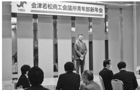
会員が更なる飛躍を誓った新年会

議員、菅家一朗衆議院議員、室井照平会津若松市長から祝辞をいただき、佐瀬正行副会頭の乾杯で祝宴に入り、会員、関係各位との懇親を深めた。