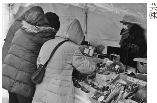
会津漆器の掘り出しモノを買い求める市民ら

「出店事業所」 （有）会津クラフト／イナムラ物産／（有）大沼漆器店／（株）台和会