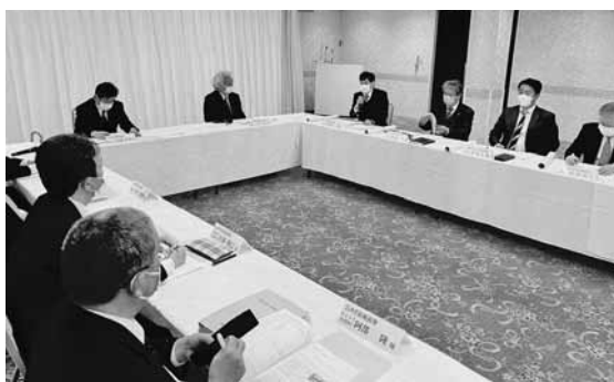
確定申告期の協力を確認した理事会