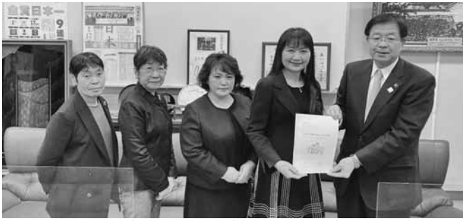
正副会長より提言書を市長へ手渡した