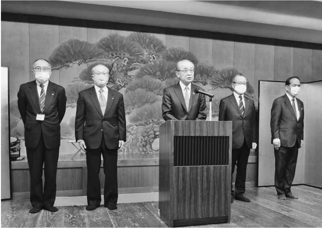
持続可能な地域の創生の実現へ向け抱負を述べる星副会頭

1月4日、萬花楼において議員新年会を開催。感染防止の観点から若干規模を縮小しての開催であったが、来賓及び役員・議員76名が出席し、新年の門出を祝った。