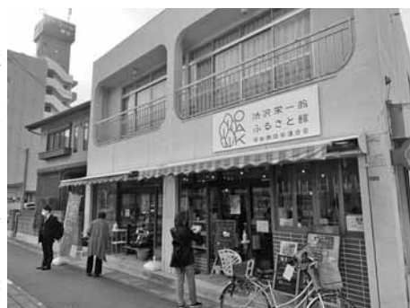
深谷市での地域通貨参加店の見学

の後、実際に商店街を視察し空き店舗の活用例を学んだ。2日目は深谷市役所を訪問。地域内経済循環を目的に発行された「地域通貨ネギー」について説明を受けた。約800店舗で利用が可能で、プレミアム商品券事業も活用し、高い普及率を実現。ポイント付与もあり、訪問した店舗でも「年末売り出しでポイントがつき、喜ばれた」との声が聞かれた。 参加者は自らの商店街活動や部会事業に活かそうと、様々な質問や意見を出し合い、実りある時間を過ごした。