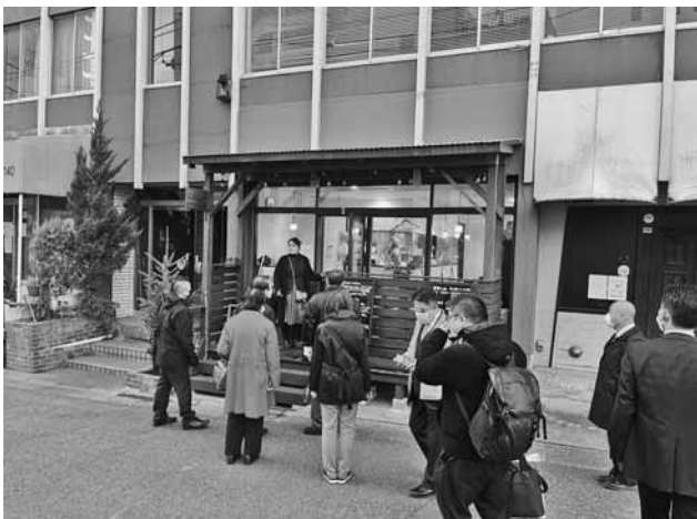
春日部市での空き店舗活用事例見学

初日の春日部市では若手経営者による商店街組織「粕壁商店街NEXT PROJECT」と意見交換を実施。同団体は春日部駅東口商店会連合会の若手を中心となり、空き店舗活用やイベント開催に取り組んでいる。商店街の空き店舗は住居併用のため賃貸に消極的なオーナーも多く、不動産活用セミナー等を通して活用結び付けていると説明。そ