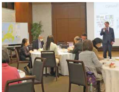
EUとベルギーの関係について話すホネカンプ氏