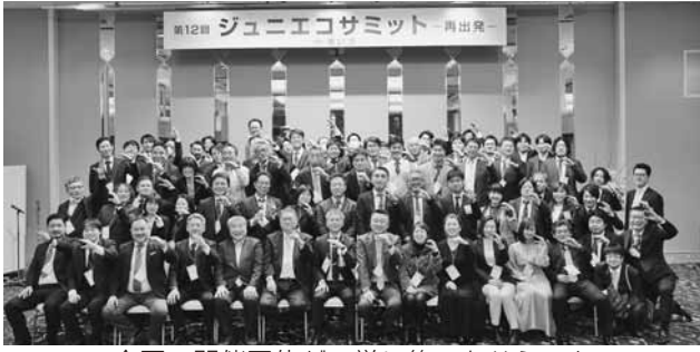
全国の開催団体が一挙に集ったサミット