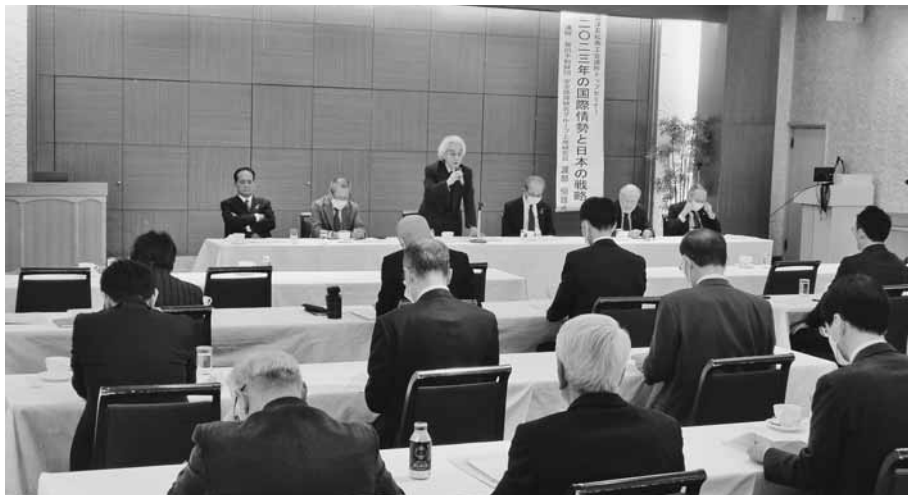
地域経済の活力を取り戻すため、更なる協力を求める洪川会頭

に取り組み事業所の支援を優先に取り組んできた。しかし、中小・小規模事業者を取り巻く環境は、今後更に厳しさを増すことが予想される。まだまだ先行きが不透明な状況であるが、我々の力で地域を盛り上げるため、皆様のさらなるご支援ご協力をお願いしたい。本日の議員懇談会では、各部署の進捗状況と新年度の事業計画について発表していた。当所の根幹をなす部会活動について、新年度も部会活動の活性化に向け、共通認識のもと、連携しながら進めていきたい」とあいさつし懇談に入った。当所には業種ごとに組織する9つの