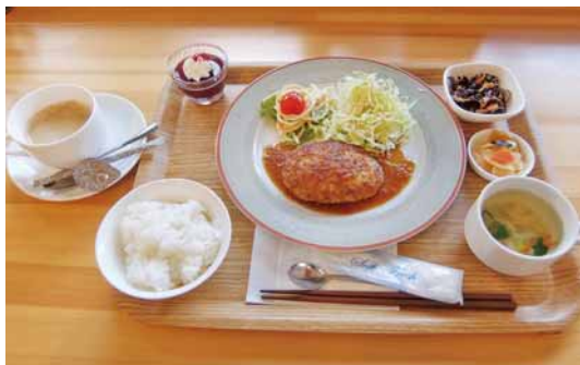
お豆腐ハンバーグセット

住所：追手町3-27 電話：27-1024 営業時間：10:30～17:30 定休日：毎週月曜日、第1・3日曜日 駐車場：店舗隣に専用駐車場あり