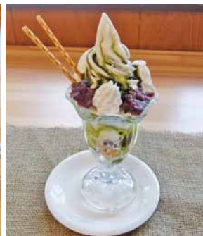
あんこも手作り豆乳ソフト小倉パフェ