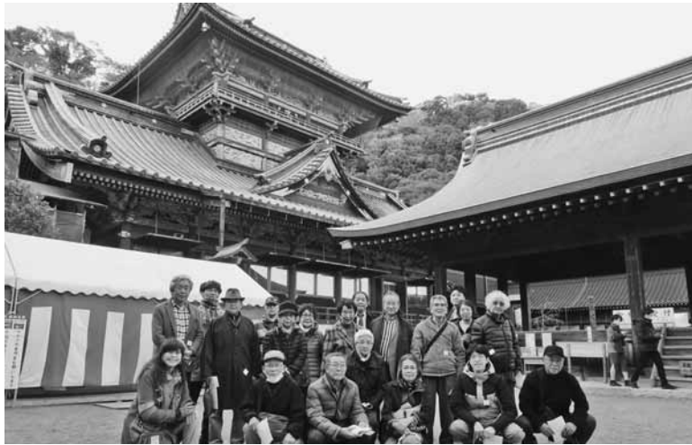
徳川ゆかりの地を満喫した共済ツアー

2月4日・5日の2日間実施した第39回共済ツアーは、徳川家康公や徳川家など、静岡の歴史や文化に触れるツアーとして実施、会員20名が参加した。