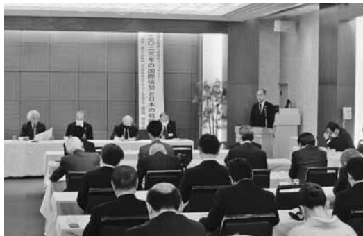
各部署の取組を共有した懇談会

部会が、各業界の課題解決のため、様々な事業を実施している。懇談では、各部長等がこれまでの事業経過と、新年度事業計画をそれぞれ説明。各部署、業界の抱える課題は様々で、各部署が特色ある事業を展開しており、今後も部会同士の連携を密に、更に活発な事業を展開していくこととした。