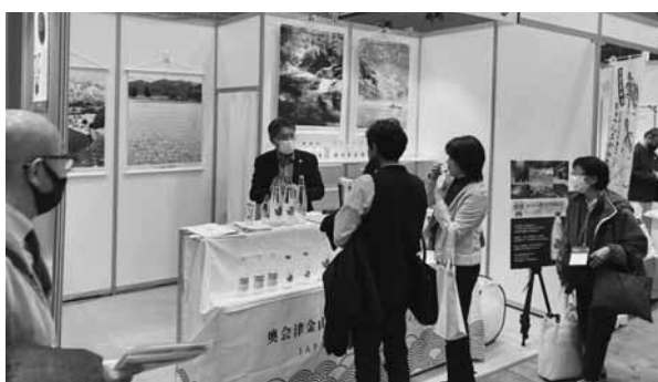
来場者に向けてPRを行うブランドブース