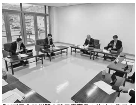
DX展示会開催等の新年度事業を決めた委員会

展示会は大都市圏で数多く開催されており、業務効率化に役立つ最新のITツールやシステム等に触れる機会となっている。しかし地方でこうした機会は少ないのが現状。本展示会は各種の業務支援システムや機器類を展示し、実際に触れて導入意欲を高める。