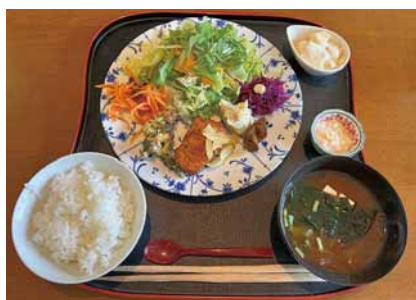
一番人気のVegemahiプレート

○住所：会津若松市城東町2-8 ○電話：090-1212-8337 ○営業時間：11:30～14:00 (令和6年4月17日現在) ○定休日：月・火曜日 ※詳細は、Instagram、Facebookなどでご確認ください。