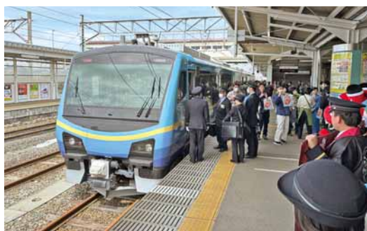
運行開始した「あいづSATONO」

JR磐越西線郡山ー喜多方駅間を走る観光列車「あいづSATONO」が4月6日に運行開始したことを受け、当所では、会津若松市・(一財)会津若松観光ビューロー・会津まつり協会と合同で乗客を歓迎する「おもてなし」を実施した。当日は駅ホームにて会津産はちみつと観光ガイドブックのセットを手渡したほか、マスケットキャラクター「あかべえ」が乗客を出迎えた。