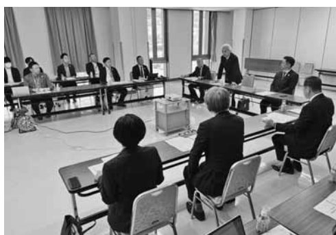
プレミアムポイント事業を総括した委員会

Tコンソーシアムで実行委員会を組織して実施に当たった。402店舗が参加し、昨年12月から本年2月末まで利用期