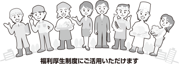
福利厚生制度にご活用いただけます