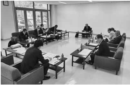
事業報告・収支決算を承認した評議員会