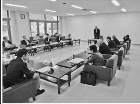
要望活動の状況を説明する渋川会頭