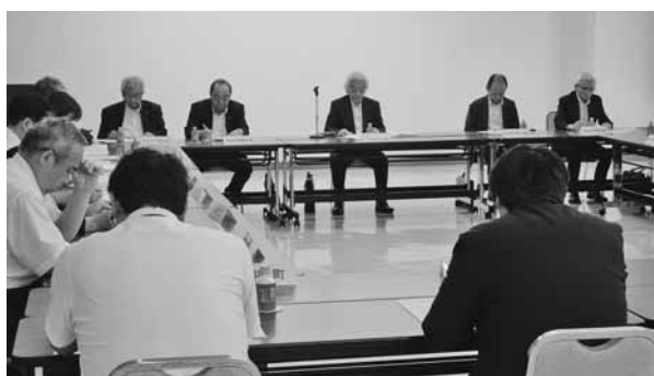
沿線自治体等の団結を呼びかける渋川会長

議事では関連規約を改正し、新たに福島県西会津町および同商工会、にしあいづ観光交流協会の会員加盟を承認した。県内沿線が一丸となって活性化に取り組むことが目的で、ワーキンググループを設けることも合わせて決めた。 このほか協議会の新規事業として、公式インスタグラム開設、昨年度実施したフォトコンテスト受賞作品を活用した沿線ガイドポスター作製に取り組み。 総会終了後、県生活交通課