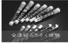
会津給ろうそく体験