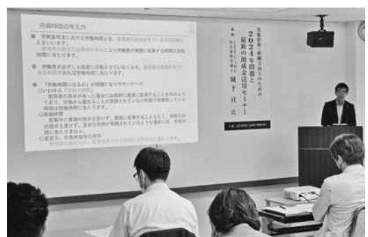
労務管理について対策や方法などを学んだ

意点については、令和3年に大きな変更があったことから、参加者からは多数の質問があった。参加者は、今後の許認可届出に係る食品表示法・衛生法の注意点について理解を深めた。