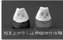
起き上がり小法師絵付け体験