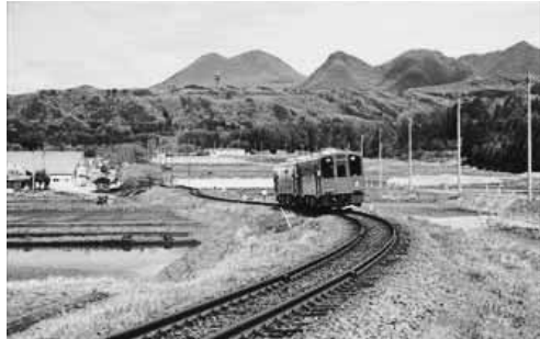
夏休みは特急で浅草に行こう！

会津・野岩鉄道利用促進協議会では、夏休み期間中、会津・野岩鉄道を利用してご家族で東京（浅草・北千住）方面へ旅行される方を対象に中学生以下の子ども分運賃の助成を行います。 東京スカイツリータウンや東京屈指の観光名所・浅草寺のある浅草、国立科学博物館や上野動物園がある上野など、見どころ盛りだくさんの東上町へ、会津・野岩鉄道を利用して夏休みに家族で出かけましょう。 ◆期間 7月20日（土）～8月25日（日） ◆対象 会津地域在住の中学生以下の子どもを含む2人以上の家族で「浅草往復列車たびきっぷ」と会津田