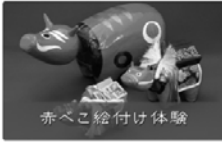
赤べこ絵付け体験