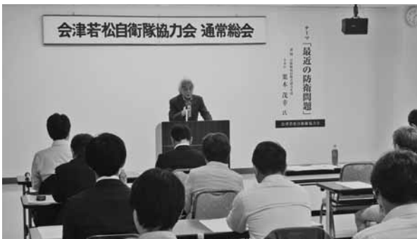
隊員を激励し、支援の継続を誓う渋川会長