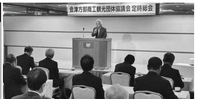
要望活動の継続を呼びかける渋川会頭