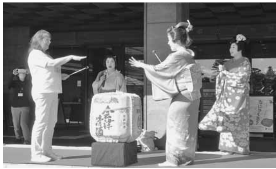
酒樽を使ったお座敷遊び体験を楽しむ参加者