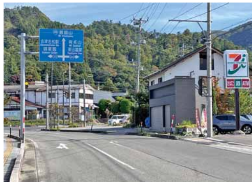
東山温泉へ向かう立地で観光客の利用も多い