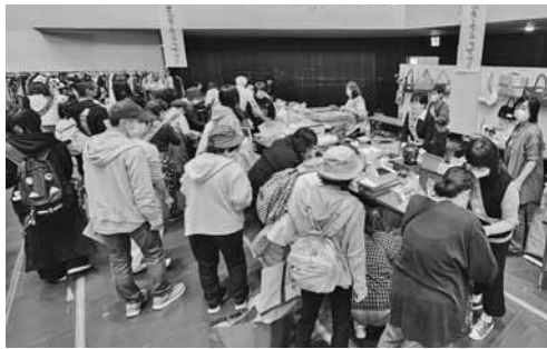
賑わう女性会ブース

当日、会場となった第32回会津若松市環境フェスタinあいつの来場者は1,200人を超え、当女性会のバザーブースも家族連れなど多くのお客様で賑わった。なお、本チャリティーバザーの益金は社会福祉に役