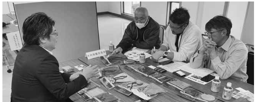
熱心に自社製品を説明する商談会の様子

お座敷遊び体験を実施。「紅葉の橋」「観光小唄」の舞で魅了した後、酒どころ会津にちなみ、お猪口や酒樽を使ったお座敷遊び体験が行われ、日頃芸妓文化に触れる機会が少ない外国人や女性、子どもたちも積極的に参加していた。 イベント最後には芸妓衆と記念撮影が出来る時間を設け、芸妓文化を肌で感じてもらう、会津には東山芸妓という伝統芸能が息衝いている事を知ってもらおう良い機会となった。