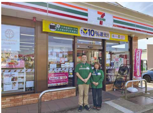
接客一番でおもてなしする折笠オーナー夫妻

今回の事業所はいけんは、「有限会社おりかさ」さんにお邪魔しました。会津若松の奥座敷・東山温泉へと向かう、奴郎ヶ前交差点にある、セブンイレブン会津東山店を経営しています。今年10月には法人化して60年の節目を迎えました。