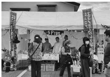
工夫して完売を目指した児童ら

当所青年部は、10月19日・20日、鶴ヶ城体育館付近で開催された会津ブランドものづくりフェアにおいて、「第22回ジュニアエコノミーカレッジ in あいづ」販売実践を行いました。11チーム55名が参加した。ジュニアエコノミーカレッジは、小学生5・6年生を対象に商売体