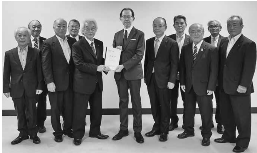
内堀知事に要望書を手渡す渋川会長(中央)

方商工会議所会頭）から「会津地域への誘客に向けた観光振興策の強化」と「小規模企業政策の充実強化」について要望趣旨を説明し、要望書を手渡した。