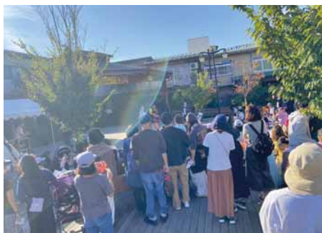
多くの来場者で賑わった会津ハロウィン

販売、キッチンカーの出店でイベントを盛り上げた。来場者からは、好評の声を多数いただいた。当所青年部では、次年度以降も地域活性化へ向けた取り組みを進めていく。