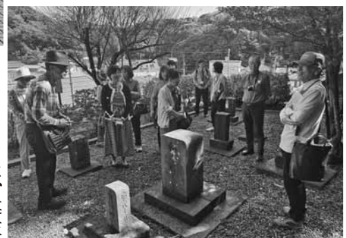
会津藩士の墓の説明を聞く参加者

2日目は、幕末、三浦半島の沿岸警備や台場構築の任務に当たった会津藩士とその家族が眠る腰越墓地を参拝。その後、旧陸軍が建設した砲台跡の中から、ほぼ当時の状態のまま残されている「三軒家砲台跡」も見学した。 横須賀のご当地グルメ「海軍カレー」「ネイビーバーガー」や、三崎の新鮮なマグロを堪能しながら、横須賀・三崎の防衛に尽力した会津藩士たちの功績を偲ぶ旅となった。