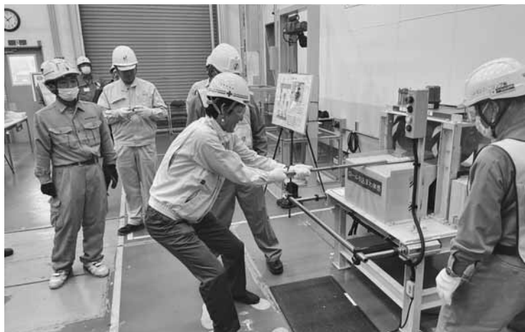
業務に潜む危険を体感する参加者

リアル(株)若松製作所内の安全教育訓練センター内で実施されている。当日は玉川エンジニアリング(株)の中災防危険体感訓練トレーナー教育受講者が講師を務めた。