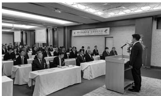
県内10単会の連携を確認した会員大会

この大会は福島県内の青年経済人が、交流と研鑽を通じて時代への先導者としての意識高揚を図るとも