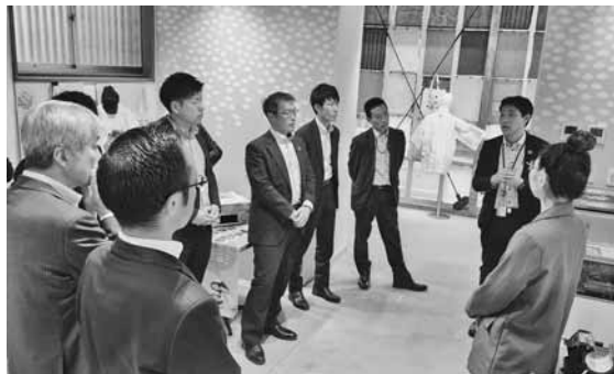
伝統文化へのデジタル技術活用事例に触れる参加者

当所金融部会（地武部会長）は10月9日、金融機関担当者と当所経営指導員との情報交換会を開催。事業者支援に携わる現場担当者14名が出席し、事業所支援や地域貢献の取組等を共有した。 この情報交換会は、支援機関同士が連携すること、より充実した支援に繋げることを目的に例年開催している。 今回は情報交換に加え、スマートシティA i C T入居企業のセイコーエプソン(株)が行う地域課題解決に向けた取組事例の紹介と、本年7月に