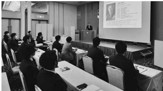
財務について学んだ勉強会の様子