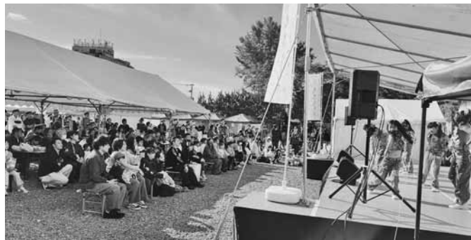
大盛況だった市民によるステージイベント