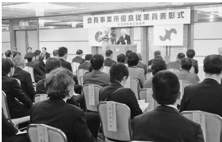
優良従業員、来賓ら101名が出席した表彰式