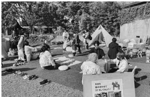
にぎわいを見せるキッズスペース

イベント当日は秋晴れの穏やかな天気となり、多数の来場者が訪れた。会場には、グルメや雑貨、農産物の物販ブースのほか体験ブースなど、約50店舗が集結。また、小さな子供向けに設置したキッズスペースでは、親子で楽しめるワークショップを開催。ダンスやマジックショー等のステージイベントも繰り広げられた。二日間合わせて約5,200名が来場し、来場者からは、今後このようなイベント開催を望む声も寄せられた。