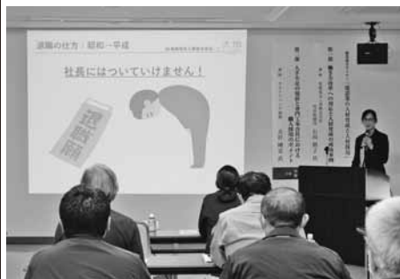
説明に注意深く耳を傾ける参加者