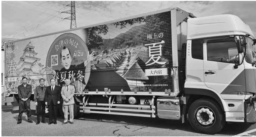
お披露目されたラッピングトラック

さつ。今年度は、「会津の四季」をテーマに、側面に「春の鶴ヶ城」「夏の大内宿」「秋の塔のへつり」「冬の只見線」をプリントし、四季の中でそれぞれ違う表情を持つ美しい風景デザイン。更に、市の公式PRキャラクターである「会津侍若松つん」と市の観光ナビの二次元コードを施し、