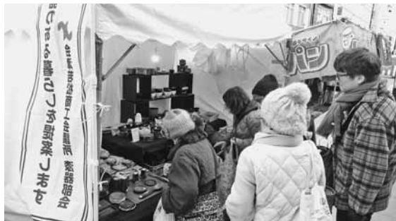
昨年の当ブースの様子