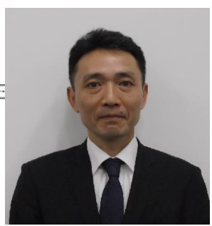
東京海上日動リスクコンサルティング株式会社 経営企画部 主席研究員

1965年生まれ。1988年4月東京海上火災保険株式会社(現東京海上日動火災保険株式会社)入社。 入社以来、リスクマネジメント関連業務を幅広く担当。財物関連、自然災害関連のリスク評価や事故防止支援。シンガポール駐在時(4年間)は、東南アジア・中国南部エリアのリスクマネジメント関連業務を担当。自動車メーカー出向時(4年間)は、当該企業の危機管理態勢整備、内部統制態勢整備等を担当。東京海上日動火災保険(株)におけるCSR全般、環境関連業務を担当。自動車の事故削減コンサルティングに従事。2013年7月以降現職(仙台に常駐し、東北6県のお客様に対するBCPを含むリスクマネジメント関連業務を担当)