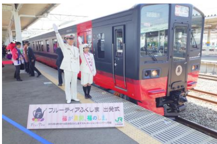
フルーティアふくしま号