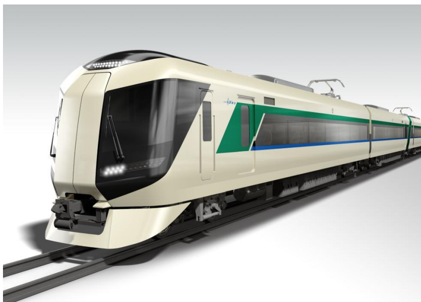
新型特急車両イメージ