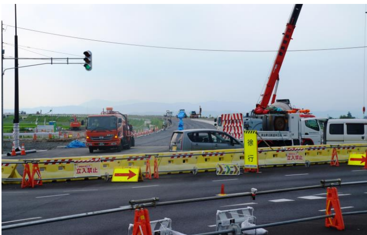
← 9月6日に全線開通に向けて工事中の会津縦貫北道路