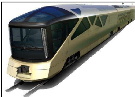
トランススイート四季島イメージ